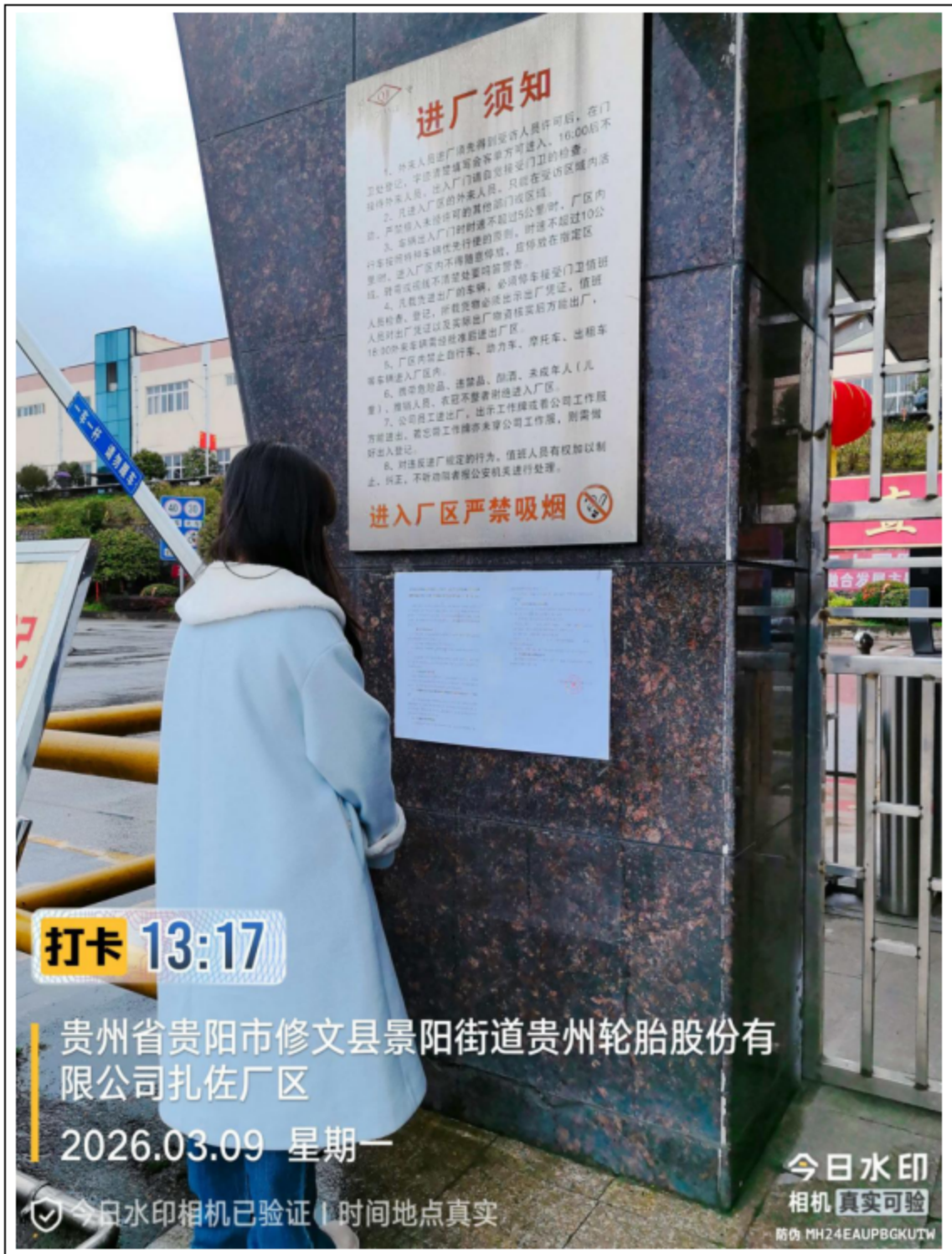
图 3-2 建设项目现场公示照片