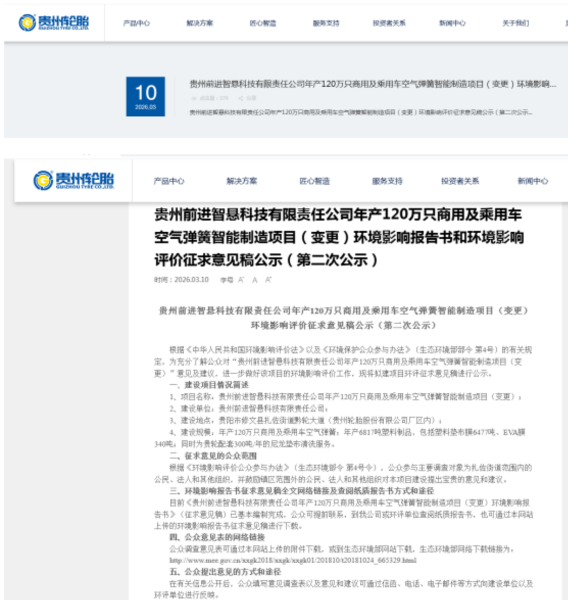
图 3-1 征求意见稿公示截图