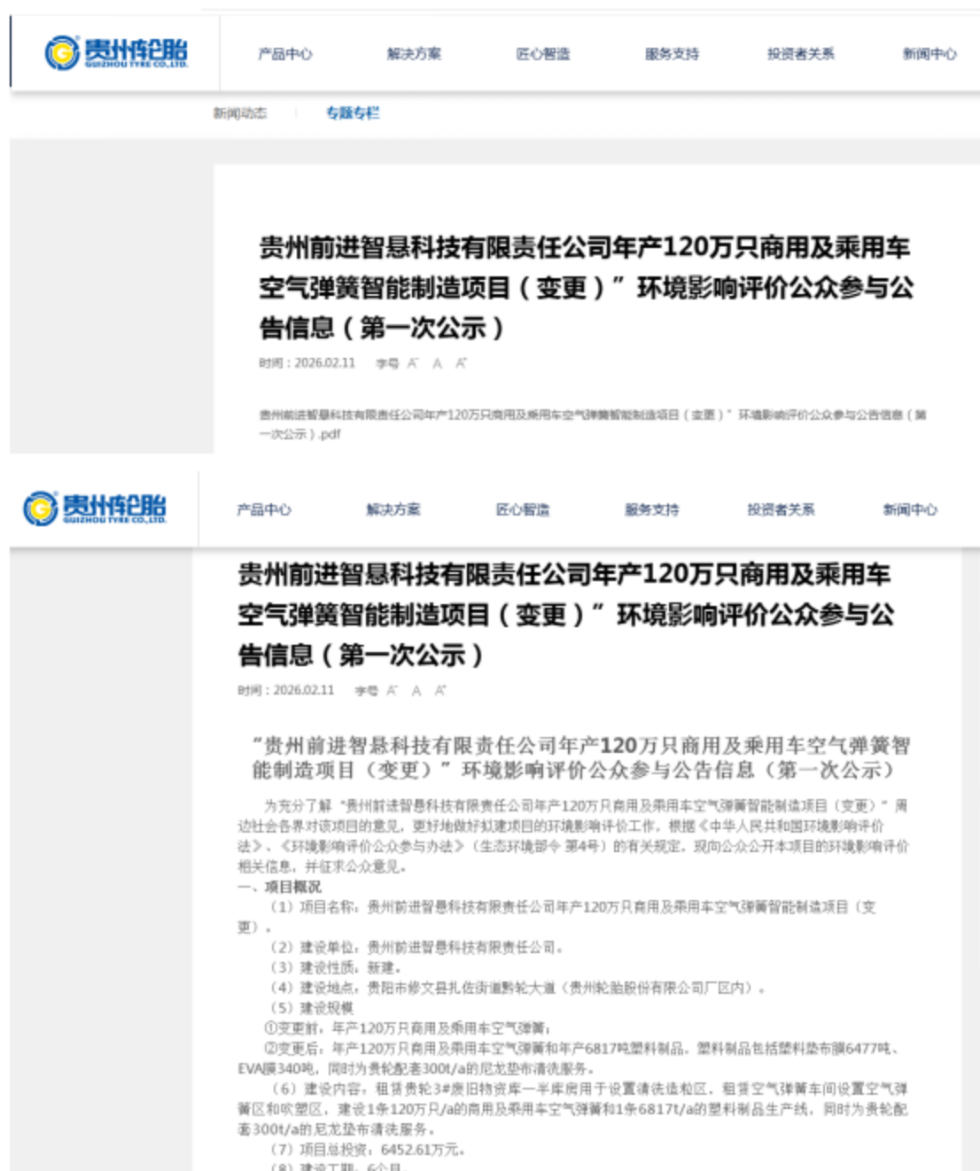
图 2-1 贵州轮胎网（即总公司贵州轮胎股份有限公司的官方网站）公示情况

根据《环境影响评价公众参与办法》（生态环境部令第4号）中第九条要求，建设项目环境影响评价公众参与第一次公示应通过建设单位网站、建设项目所在地公共媒体网站或者建设项目所在地相关政府网站进行公示。本项目第一次公示于2026年2月11日贵州轮胎网（即总公司贵州轮胎股份有限公司的官方网站），其公示载体与《环境影响评价公众参与办法》相符合，公示情况见图2-1。