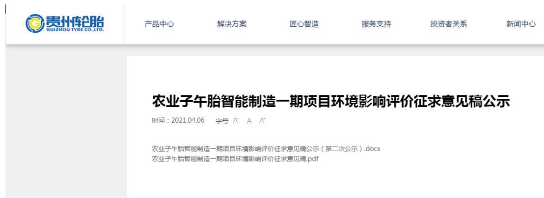
图 3-1 征求意见稿公示截图