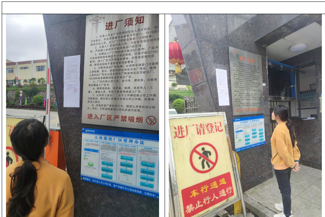
图 3-2 建设项目现场公示照片