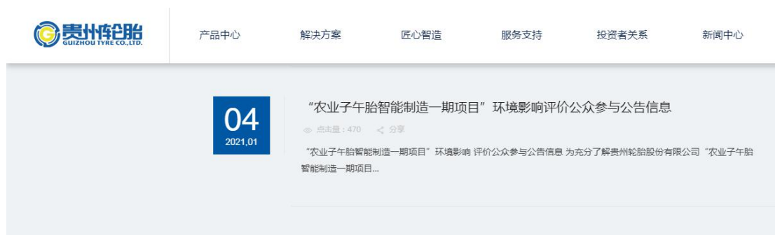
图 2-1 贵州轮胎网（建设单位官网）公示情况

根据《环境影响评价公众参与办法》（生态环境部令第4号）中第九条要求，建设项目环境影响评价公众参与第一次公示应通过建设单位网站、建设项目所在地公共媒体网站或者建设项目所在地相关政府网站进行公示。本项目第一次公示于2021年1月4日贵州轮胎网（建设单位官网），其公示载体与《环境影响评价公众参与办法》相符合，公示情况见图2-1。